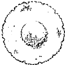
Πιάτο με οδοντωτό χείλος και πολύχρωμο διάκοσμο, «ποτισμένο» με μπλε φαγεντιανά του Σω. Περίπου 1780. (Musée national de Céramique, Σεβρ).

— Σω, φαγεντιανά και πορσελάνες του (Sceaux) φαγεντιανά και είδη πορσελάνης τα οποία παράγονταν στο εργαστήριο του Ζακ Σαπέλ (Jacques Chapelle), που ιδρύθηκε στο Σω το 1748. Υπό την προστασία της δούκισσας του Μαιν, ο Ζακ Σαπέλ κατασκεύαζε αρχικά είδη από μαλακή πορσελάνη, την παραγωγή της οποίας αναγκάστηκε να διακόψει το 1749 λόγω του αποκλειστικού προνομίου του εργαστηρίου των Σεβρών. Αλλά και τα φαγεντιανά του, με πρωτότυπη διακόσμηση και ψημένα σε χαμηλή φωτιά, αντικατοπτρίζουν την προτίμησή του για την πορσελάνη: φόρμες περίτεχνες με ανάγλυφα «ροκάιν», εκλεπτυσμένος διάκοσμος με άνηθ, πουλιά, ρωπογραφικές σκηνές, ζωγραφισμένα σε απαλά