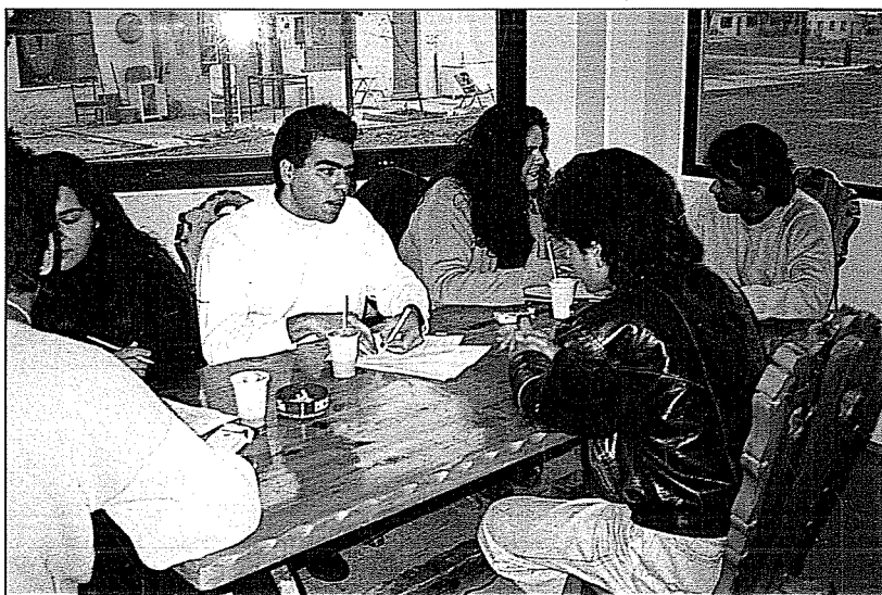
Μέλη της Ερευνητικής Ομάδας παίρνουν συνεντεύξεις από νεαρούς κρατούμενους στις Φυλακές Ανήλικων της Κασσαβέτειας τον Οκτώβριο 1993

Π ώς μπορεί να βελτιωθεί η κατάσταση; Σίγουρα όλοι έχουμε τις ευθύνες μας και όλοι μπορούμε να βοηθήσουμε: Ο νομοθέτης, αλλάζοντας επιτέλους το απαρχαιωμένο νομικό πλαίσιο περί ανήλικων, που στηρίζεται σ' έναν κακώς νοούμενο πατερνλιστικό «σωφρονισμό» τους. Ο αστυνόμος και ο δικαστής, αποφεύγοντας μιαν αδικαιολόγητη αυστηρότητα απέναντι σε