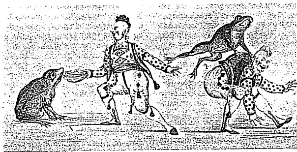
Ο Τζόζεφ Γκριμάλντι ως κλόουν στο «Αρλεκίν Παντιμανόνα» ή «Το χρυσόψαρο», μια χριστουγεννιάτικη παράσταση παντομίμας που παρουσιάστηκε στο Κόβεντ Γκάρντεν του Λονδίνου το 1811. Γκραβούρα, 19ος αιώνας. (Victoria and Albert Museum, Λ. Ίδρυο).

Τα «νούμερα» κλόουν αποτελούσαν στοιχεία στενά δεμένα με τη σκηνική δράση των μενεστρέλων και των ζωνγκλέρ στη διάρκεια του μεσαίωνα, αλλά ο καθαυτό κλόουν, ως επαγγελματίας, εμφανίστηκε μόλις