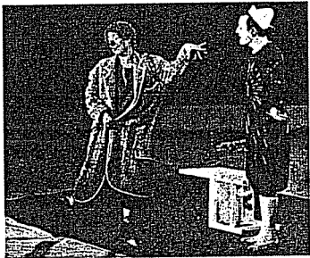
Ο κλόουν Pierre Etaix πουδραρισμένος, στην πίστα του τσίρκου Etaix με την παρτενιά του Annie Fratellini.

κλόουν , ο (clown): εξαιρετικά δημοφιλής κωμικός χαρακτήρας της παντομίμας ή του τσίρκου, που ξεχωρίζει χτυπητά με το έντονο μακιγιάρωμα και την ιδιόμορφη περιβολή του, με τα γελοία κομμάτια του, τα χοντρά («μπουφόνικα») χωρατά του, με στόχο πάντα να προκαλεί το εκρηκτικό γέλιο. Αντίθετα με τον αξιοθρήνητο, συνήθως, παραδοσιακό γελωτοποιό* ή «τρελό» (τον «τζέστερ» στα Αγγλικά), ο κλόουν εκτελεί ένα καθορισμένο πρόγραμμα, που χαρακτηρίζεται από πλούσιο, ανθρόρ χιούμορ, αλλόκοτες καταστάσεις και ζωηρή, σφριγηλή κίνηση και σωματική δράση.